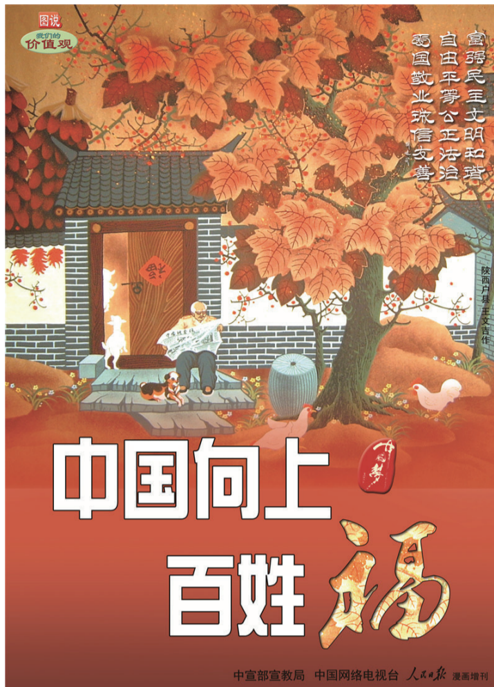
中宣部宣教局 中国网络电视台 人民日报 漫画周刊

随着春节日益临近年的气息越来越浓了腊肉香肠迫不及待想犒劳远道归来的游子玉米辣椒成串缀满墙壁醒目的丰年的隐喻